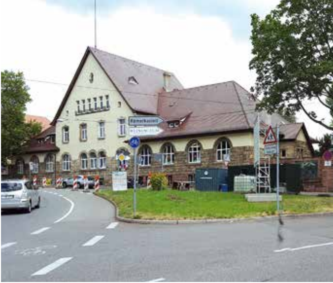
Der Platz an der Altenburger Steige

Im Zuge der umfangreichen Straßenbaumaßnahmen entsteht im Hallschlag auch ein neuer Platz. So langsam werden seine Konturen erkennbar.