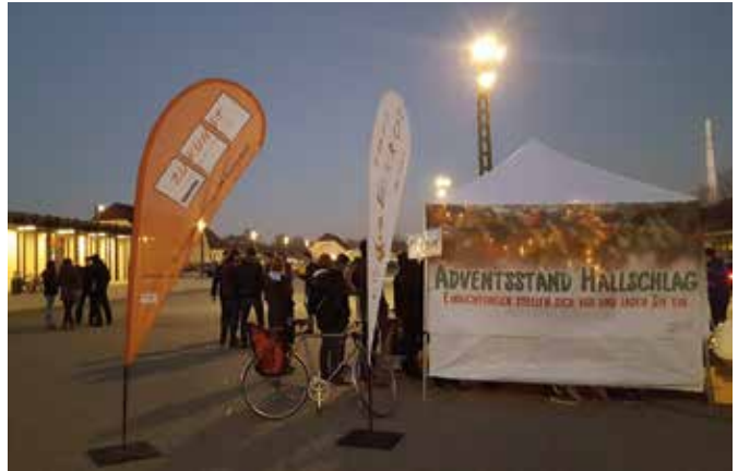
Impression vom letztjährigen Adventsstand