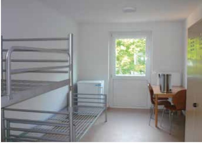
Einfach aber funktional: die Zimmer der Gemeinschaftsunterkunft

Dipl.-Päd. Marja Rothenhöfer, Teamleitung Sozialberatung