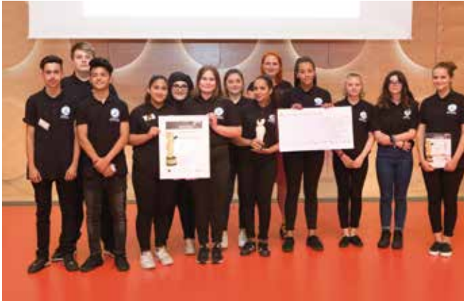
Preisverleihung Würth Bildungspreis

Die diesjährigen Neuntklässler nahmen bereits in der zweiten Schulwoche am Modul II des „Berufe Castings“ in der Handwerkskammer teil. Hier vertieften sie ihre Fähigkeiten in drei Berufen. Die SchülerInnen konnten sich intensiv in den Berufen Feinwerkmechaniker, Schreiner, Raumaustatter, Büromanagement und Buchbinder ausprobieren.