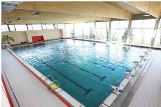
Das Vereinsbad in der Neckarvorstadt ist für die Mitglieder fußläufig zu erreichen

SV Cannstatt 1898 e.V. Krefelder Str. 24 70376 Stuttgart / Bad Cannstatt