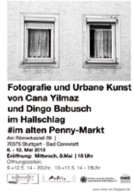
Der Flyer zur Veranstaltung