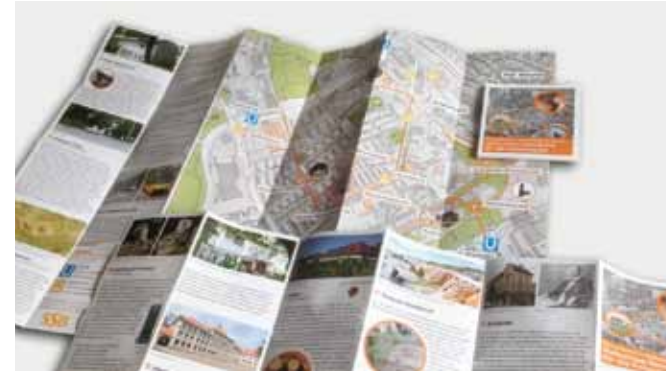
Aufgefaltet hat der Faltpapier eine Größe von DIN A2

Welche Spuren im Hallschlag führen zu Albert Einstein? Wie kommt der Nastplatz zu seinem Namen? Wo lebten hier schon Waldelefanten? Die Projektgruppe Geschichte hat jetzt die wichtigsten Orte anhand eines Rundgangs zusammengefasst.