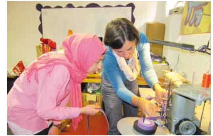
In der Taschenwerkstatt

Im Nachbarschaftszentrum lohnt sich ein Blick ins Untergeschoss.