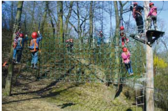
Bewegungsprojekt im Kletterpark

Im Rahmen des Bundesprogramms „VIELFALT TUT GUT“ beantragte der Förderverein ehrenamtliche Gemeinwesenarbeit im Hallschlag e.V. im Jahr 2010 erstmals den JULA-Aktionsfonds. Durch diese finanzielle Unterstützung konnten 36 interessante Projekte vor Ort umgesetzt werden.