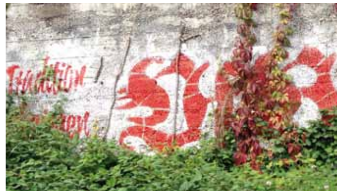
Ultra-Graffiti im Hallschlag

Graffiti ist fast so alt wie die Menschheit selbst. Schon die Höhlenmenschen haben ihre Tags mittels Wandbemalungen gesetzt und somit unter anderem mit den Ägyptern die heutige Schrift erfunden.