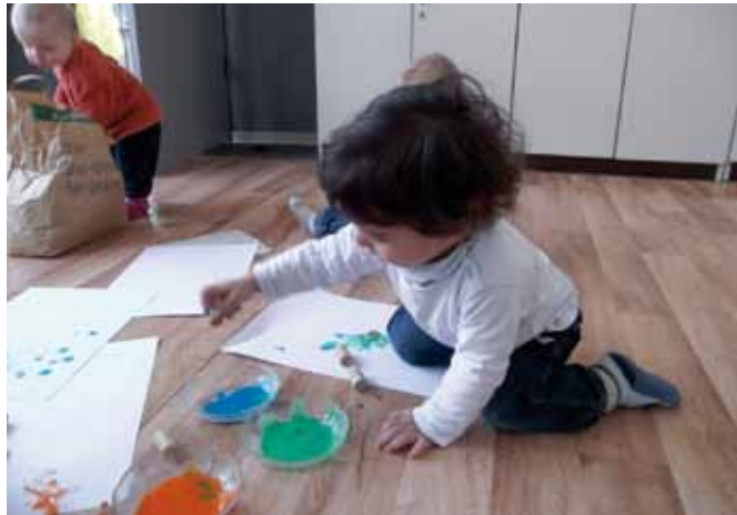
Krabbeln in der Sternstunde

Frühes fördern mit dem Early Excellence Ansatz