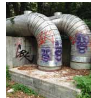
Tags im Travertinpark

Wer sich zum Spraysen berufen fühlt, sollte sich zuerst ein Skizzenbuch zulegen, um seinen Ausdruck zu üben und zu perfektionieren. Dieses Skizzenbuch kann man dann benutzen, um u.a. potentielle Auftraggeber oder legale Flächen zu gewinnen. ■