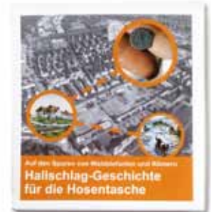
Der Faltpapier ist kostenlos erhältlich.