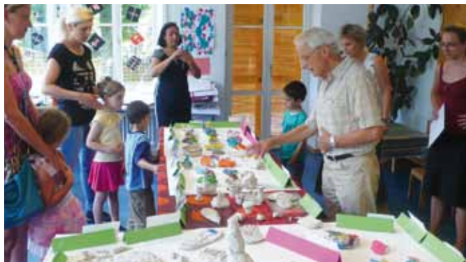
Ausstellung der Tonarbeiten

Das Projekt fand in Kooperation der Kindertageseinrichtungen in der TE Düsseldorfer Str. 8 statt. Es wurde durch den Verfügungsfonds der Sozialen Stadt finanziell gefördert.