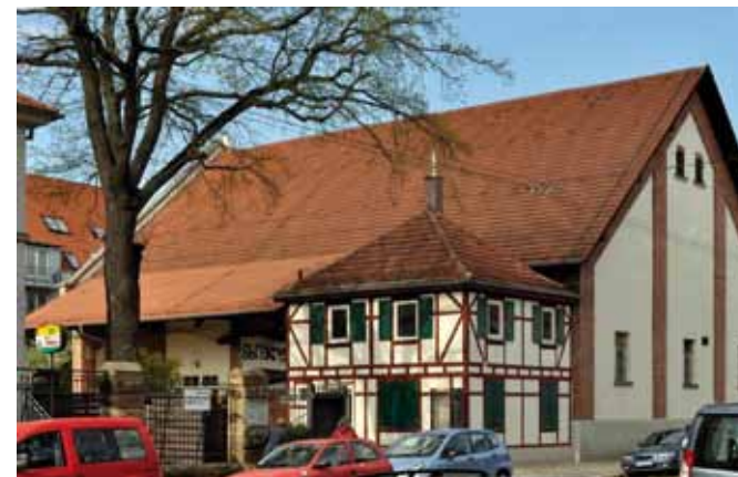
Die alte Raufutterscheune

Zum 2. September öffneten wir die Türen für insgesamt 16 Kinder einer Krippengruppe für Kinder von 0-3 Jahren und eine Kindergarten- gruppe für Kinder von 3-6 Jahren, jeweils in der Ganztages- betreuung von 7:30 - 16:30 Uhr. Wir sind unendlich dankbar für diese Möglichkeit und die freund- liche Aufnahme auf dem Gelän- de des Kirchenzentrums der Steiggemeinde. Der Umzug in die Scheune ist noch vor Weih- nachten geplant, sodass wir hof- fentlich dann in unseren eigenen Räumen schon "Weihnachten im Stall" feiern können.