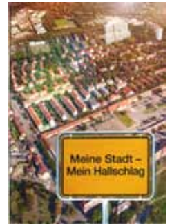
Der Stadteilführer kann kostenlos im Stadteilbüro abgeholt werden.