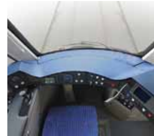
Blick ins Cockpit

zum anderen auch den Wohlgefühlcharakter verstärken. Ganz neu für Stuttgarts Stadtbahn ist die Konstruktion der elektrisch betriebenen Schwenkschiebetüren – sie gleiten während des Öffnens flach an der Außenseite des Wagens entlang und schwenken nicht mehr bogenförmig auf den Bahnsteig. Besonders ältere oder gehbehinderte Fahrgäste werden so durch die Bewegung der Türen nicht mehr verunsichert.