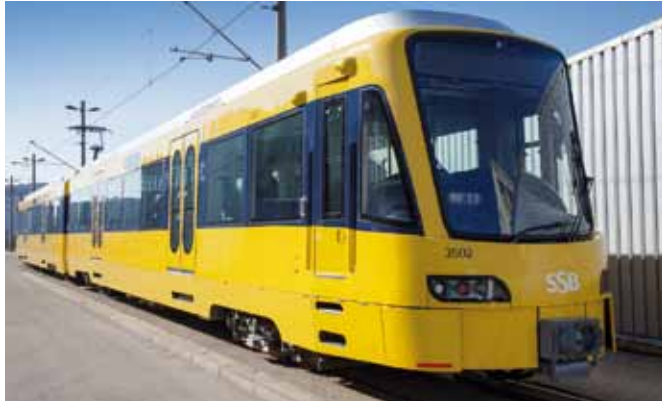
"Der Neue" bei der Einfahrt

Neuer Stadtbahnwagen auch im Hallschlag unterwegs