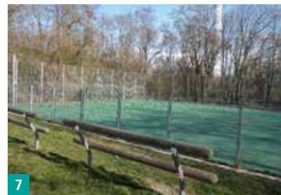
7 Bolzplatz im Grünen