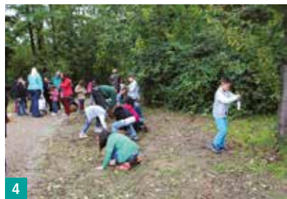
4 Kinder pflanzen Blumen im Travertinpark