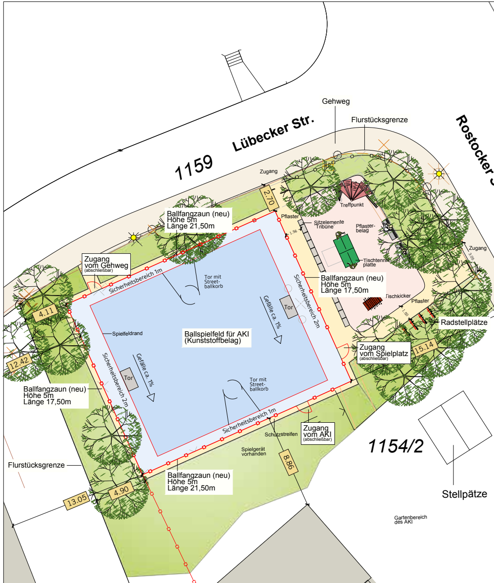
Planausschnitt: Gestaltungsplan von Werner Winkler, Winkler & Boje

Modernes Ballspielfeld für die Drachensinsel