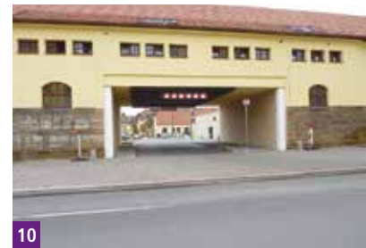
10 Eingang Römerkastell