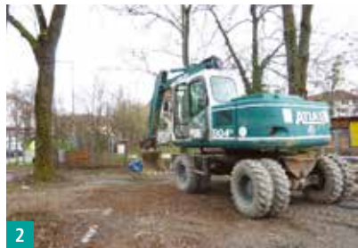
2 Ballspielfeld Dracheninsel Bauarbeiten gestartet