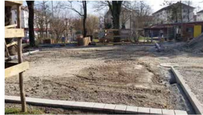
Solider Untergrund für den neuen Ballspielplatz

Schon lange wünschen sich die Kinder, Eltern und Betreuer der Drachensinsel eine Erneuerung des Ballspielfeldes. Das Kicken auf dem alten Schotterbelag wurde dort immer mehr zu einer staubigen Angelegenheit, unschöne Schürfwunden inklusive.