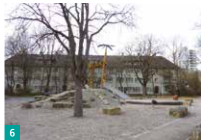
6 Viel Spaß beim Klettern, Spielplatz Bottroper Straße