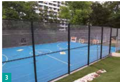
3 Moderner Bolzplatz an der Dessauer Straße