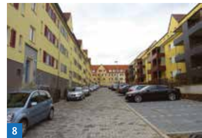
8 Verkehrsberuhigte Bereiche