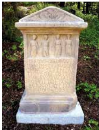
Beispiel: Quadruviae Vierwegestein

Eine Übersicht der Baumaßnahmen im Hallschlag finden Sie in der Heftmitte (Seite 20-21)