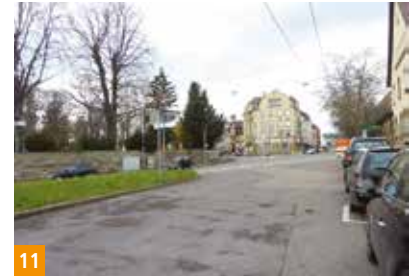
11 Hier entsteht ein neuer Platz