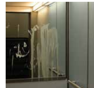
Traurig: Halloween 2015 im Hallschlag

Halloween war ursprünglich in Irland verbreitet. Die irischen Einwanderer in den USA pflegten ihre Bräuche in Erinnerung an die Heimat. Ich kann mir nicht vorstellen, dass damit Sachbeschädigung gemeint war (s. Bild vom letzten Herbst).