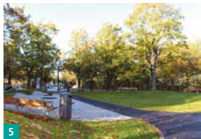
5 Grüne Oase Nastplatz

■ Spiel- und Freiflächen ■ Straßenumgestaltung abgeschlossen ■ im Bau ■ in Planung ■ Platzgestaltung 2017