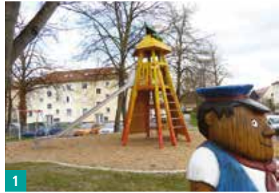
1 Spielplatz Rostocker Straße

Freiraumkonzept: Attraktive Spiel- und Freiflächen, Stück für Stück auch neu gestaltete Straßen