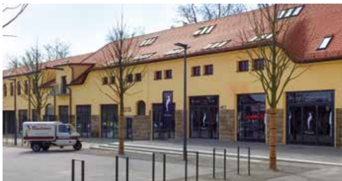
Bereits angekommen: das Ristorante Rusticone

Geschäfte und Läden eröffnen in der ehemaligen Kaserne