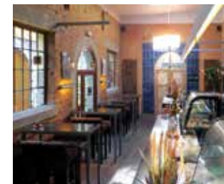
Eine leckere Auswahl an Speisen, Snacks und Getränken