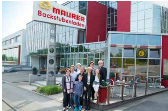
Familienbetrieb: Die Liebe zur handwerklichen Backtradition ist bei der Bäckerei Maurer seit 1931 fest verwurzelt

Bäckerei Maurer eröffnet Filiale im Römerkastell