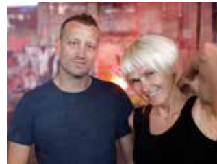
MONO & NIKITAMAN

Am 30. Oktober erschien das neue Album "Im Rausch der Bengalen" von MONO & NIKITAMAN. Live ist das Duo in Stuttgart am 29. Dezember im Kinder- und Jugendhaus Hallschlag zu erleben. Karten zu 21,60 zzgl. Gebühr sind im Vorverkauf http://www.mrusstickets.de erhältlich