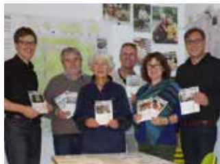
Das Redaktionsteam sucht Verstärkung