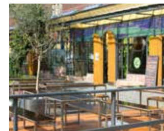
Die Terrasse des Castello Loungebistros

Montag- Freitag: 9:30 - 15:30 Uhr Samstag und Sonntag geschlossen