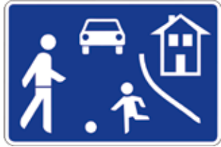
Hier gilt Schrittgeschwindigkeit

Es gibt nur wenige Parkplätze – schließlich muss Platz zum Spielen bleiben. Kinder müssen auch auf die Fahrzeuge achten - die Spielstraße ersetzt nicht den Spielplatz. ■