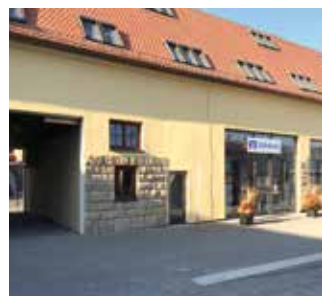
Eingang zur Volksbank mit Durchgang zur Straße Am Römerkastell

Naststraße 3 70376 Stuttgart www.roemerkastell-stuttgart.com info@roemerkastell-stuttgart.com