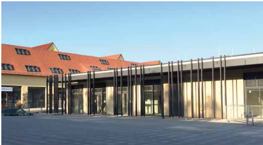
Blick auf das neue Einkaufszentrum. Im Hintergrund die Volksbank