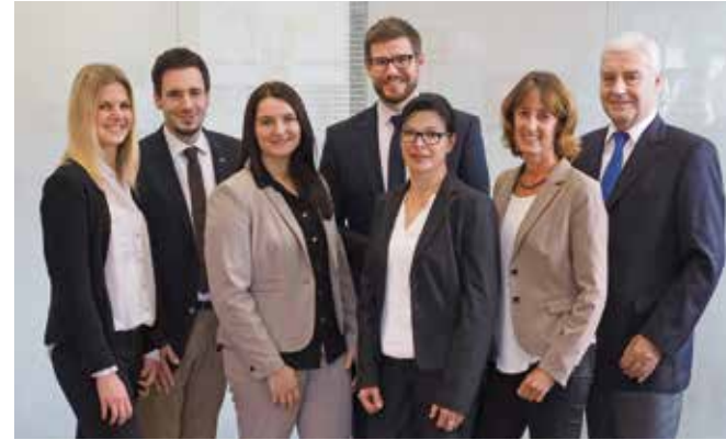
Das Team der Filiale im Römerkastell

Mit ihrer neuen Geschäftsstelle im Hallschlag bekennt sich die Volksbank Stuttgart eG nachhaltig zu dem Cannstatter Stadtteil.