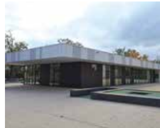
Die neue Mensa der Altenburgschule

Im Vorfeld des Länderspiels waren die Lehrerinnen und Lehrer im VIP-Bereich der Arena geladen, um sich mit DFB-Sportdirektor Hansi Flick, U19 Nationaltrainer Marcus Sorg und Vertretern von Wirtschaft und Politik in einer offenen Diskussionsrunde zum Thema "Schule und Sport" auszutauschen. Ebenso wurden Neuigkeiten seitens des DFB in Bezug auf angehende Kooperationen von Schulen mit Vereinen in den Focus gebracht. ■