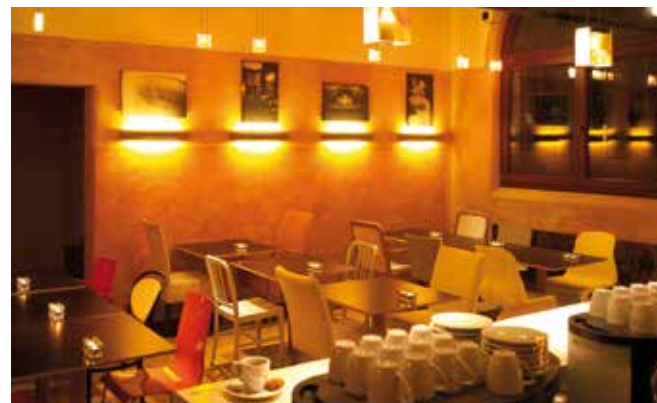
Gemütlich: Der Innenraum des Castello Loungebistros

Das Castello Loungebistro ist der gemütliche Mittagstreff im Römerkastell.