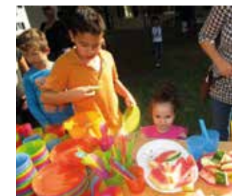
Wöchentliches, gemeinsames Grillen & Kennenlernen im Sommer 2015 (Bilder Aki, G. Müller)