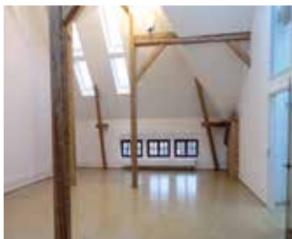
Bürofläche im Dachgeschoss

in das Römerkastell die Gruppo Cimbali Deutschland GmbH, die weltweit als größter und renommiertester Hersteller von professionellen Espresso- und Cappuccinomaschinen sowie Zubehörgeräten gilt. Zahlreiche weitere Mieter werden bis Anfang des neuen Jahres in die neuen Büros