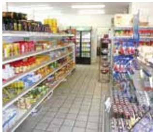
Großes Angebot im Sternmarkt

Montag - Freitag: 08:30 Uhr - 20:00 Uhr Samstag: 08:30 Uhr - 19:00 Uhr